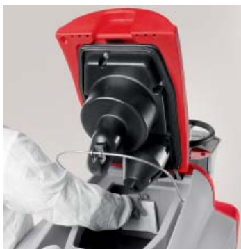
Completa sanificazione dei serbatoi

Facile nella ricarica delle batterie grazie alla possibilità di avere il caricabatterie a bordo (su richiesta)