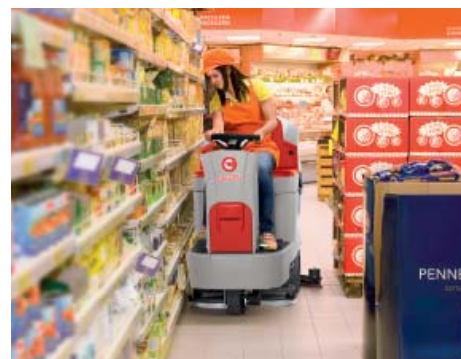
Facile sostituzione delle gomme senza l'utilizzo di utensili sull'esclusivo tergilpavimento Comac (Patent Pending)