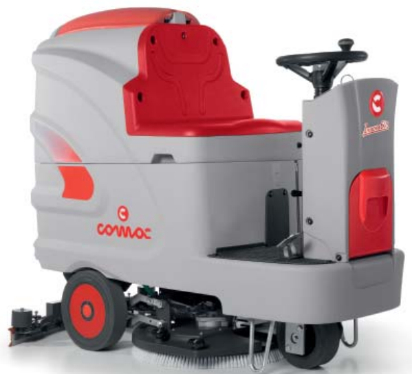
Innova 60 B